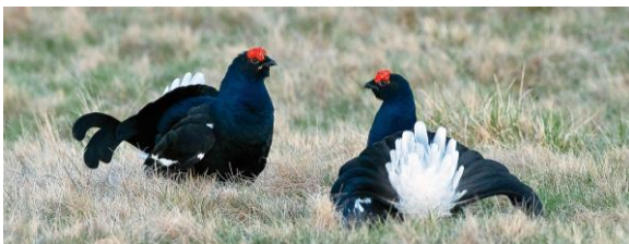
Balzende Birkhähne

Wie auch beim Auerhuhn unterscheiden sich Hähne und Hennen deutlich in Gefieder und Körpergröße. Das Weibchen ist beige braun gesprenkelt. Die Männchen zeigen sich hingegen im auffällig schwarz-weiß schillernden Federkleid. Das Tarngefieder des Weibchens ist überlebenswichtig, weil es, wie alle Hühnervögel das Nest am Boden baut und Brut und Aufzucht der Küken übernimmt.