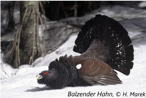
Balzender Hahn

In der Steiermark ist die Art ein regional vorkommender Jahresvogel. Die Bestände im Norden der Steiermark werden als zufriedenstellend eingeschätzt. Die Zahl der Individuen nimmt allerdings jährlich ab.