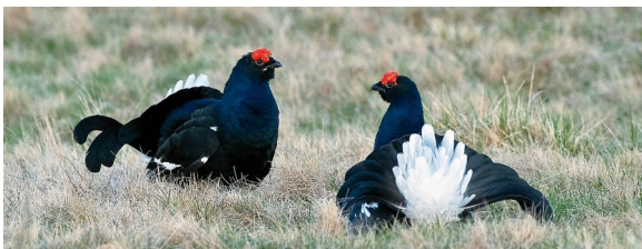
Balzende Birkhähne

Wie auch beim Auerhuhn unterscheiden sich Hähne und Hennen deutlich in Gefieder und Körpergröße. Das Weibchen ist beige braun gesprenkelt. Die Männchen zeigen sich hingegen im auffällig schwarz-weiß schillernden Federkleid. Das Tarngefieder des Weibchens ist überlebenswichtig, weil es, wie alle Hühnervögel das Nest am Boden baut und Brut und Aufzucht der Küken übernimmt.