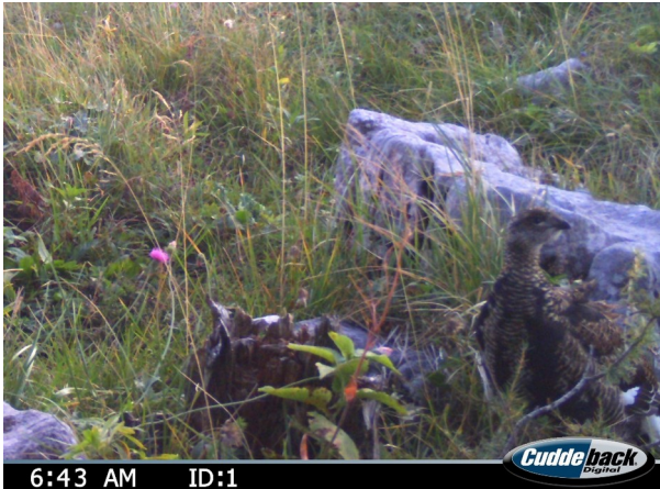
Birkhuhn-Küken von einer automatischen Wildkamera; fotografiert im Nationalpark. Weibchen sind ähnlich gefärbt und gut getarnt.

Das Nest des Birkhuhns liegt gut versteckt in einer Mulde am Boden. Die Henne legt in der Regel 7 bis 10 gelbbraune, grau bis dunkelbraun gefleckte Eier. Nach einer Brutzeit von 25 bis 28 Tagen, ca. Mitte Juni, schlüpfen die Küken. Sie sind nach weiteren vier Wochen selbstständig.