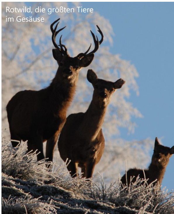
Rotwild, die größten Tiere im Gesäuse

Rotwild ist zwar heimisch, verbrachte aber in früheren Zeiten die harten Wintermonate fern der Berge in Auwäldern. Diese Auen sind heute nicht mehr vorhanden oder die Wanderwege dorthin versperrt, daher wird Rotwild im Winter bei uns gefüttert. Als Alternative bietet sich eine starke Verringerung der Rotwilddichte an. Wenige Tiere könnten auch ohne Fütterung ausreichend Nahrung finden. Allerdings wäre dieser Ansatz nur über die engen Nationalparkgrenzen hinausgehend auf großer Fläche umsetzbar.