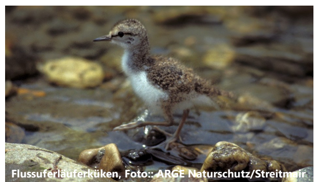
Flussuferläuferküken, Foto: ARGE Naturschutz/Streitmaier

Neben Fressfeinden sind es vor allem Hochwässer, die für die Gelege und die noch nicht flugfähigen Küken eine Bedrohung darstellen.