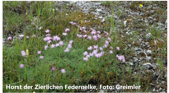
Horst der Zierlichen Federnelke

Das Besondere an der Zierlichen Federnelke ist ihr sehr kleiner Verbreitungsraum. Man findet diese Art nur in den nordöstlichen Kalkalpen auf der Südseite des Dachstein-Massivs und des Grimings, im Toten Gebirge und die größten Bestände in den Gesäuse-Bergen! Sie hat die letzte Eiszeit in diesem Gebiet überdauert und sich nach dem Rückzug des Gletschers nicht mehr weiter ausgebreitet. Wegen der geringen Verbreitung ist der Erhalt ihrer natürlichen Vorkommen ein wichtiges Ziel im Naturschutz!